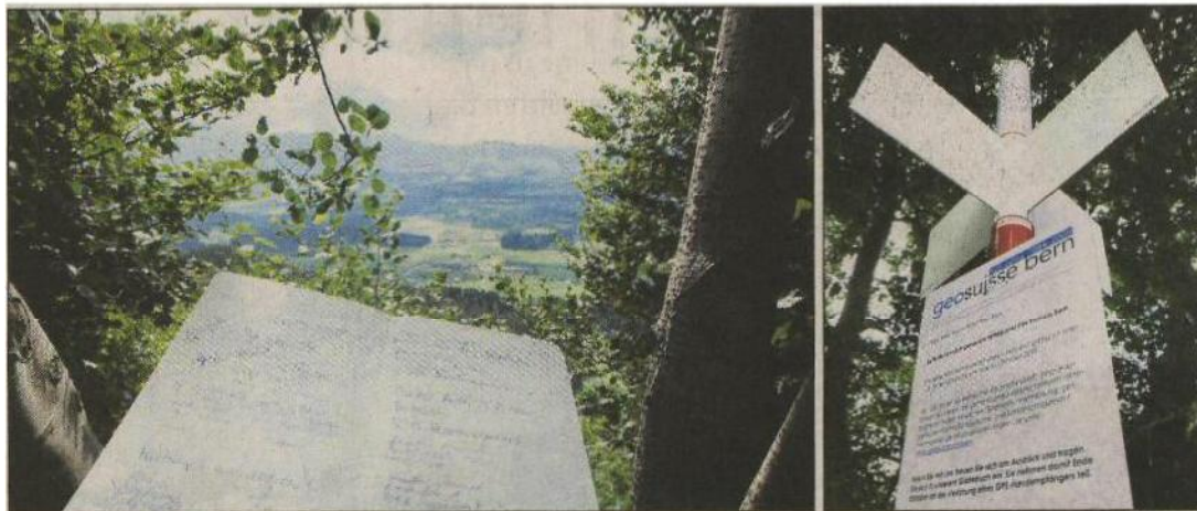
Zum 125-Jahr-Jubiläum von Geosuisse Bern haben die Geometer die Mitte des Kantons Bern auf der Falkenfluh ermittelt und ein Signal (r.) aufgestellt. Links: Der Ausblick von der Falkenfluh.

Die Vereinigung der Berner Ingenieur-Geometer feiert heuer ihr 125-jähriges Bestehen. Aus diesem Anlass haben die Vermesser die Mitte des Kantons ermittelt und dort ein Signal aufgestellt: auf der Falkenfluh ob Brenzikofen.